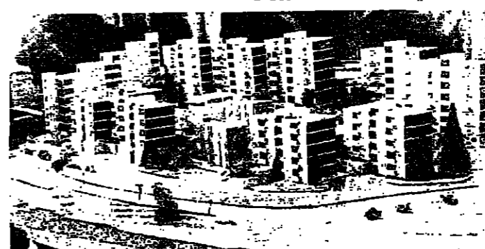
تصميم المشروع الذي يضم ١٢٩ بناية منفصلة

وقد عرض الدكتور وحيد في المؤتمر تفصيل المشروع الاسكاني الذي ينفذه نادي الحركة بتنفيذه في منطقة كفرشما ، وذلك بصفته رئيساً للنادي .